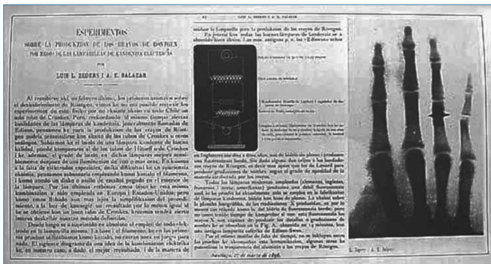
Figura 1. Publicación de los Profesores Zegers y Salazar ( http://www.sochradi.cl/comienzo_imagenes.php )